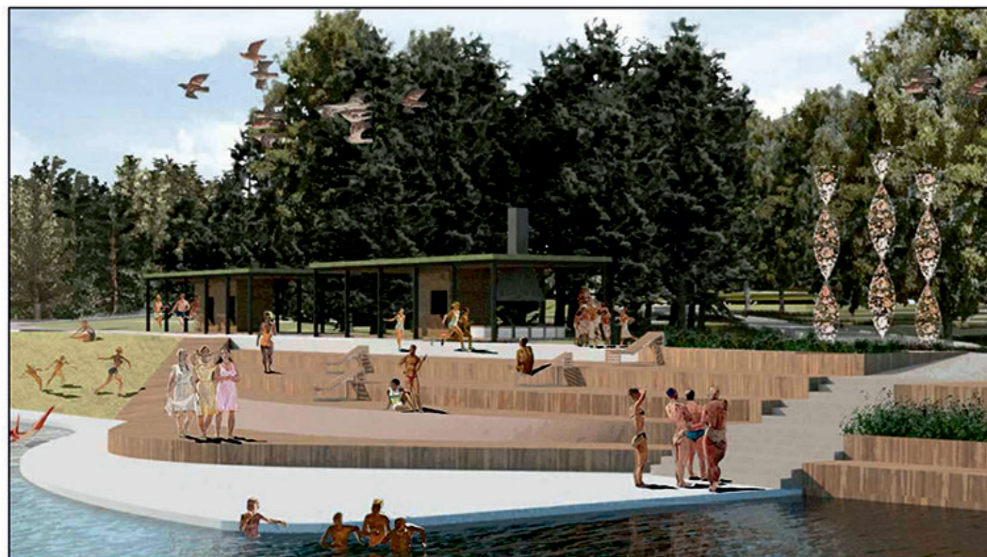
Вид на пляж с плотины

Заказчик: Администрация городского поселения город Белебей муниципального района Белебеевский район Республики Башкортостан. Куратор проекта: АНО «Институт развития городов Башкортостана» Проект разработан: ООО АБ «Проспект» г. Уфа. Подрядчик: ООО «Стройсервис», г.Белебей, ул.Сыртлановой, 1 Ответственный за производство работ: Главный инженер ООО «Стройсервис» Шамсиев А.Р. тел.: 8(962)539-66-25 Начало работ: 17.12.2019г. Окончание работ: 01.12.2020г